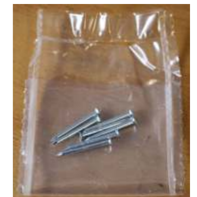
7 Stahlstifte zum Annageln

Abmaße Produkt: L x B x H 1000 x 50 x 4,9 mm Gewicht kompl.: 0,239 kg