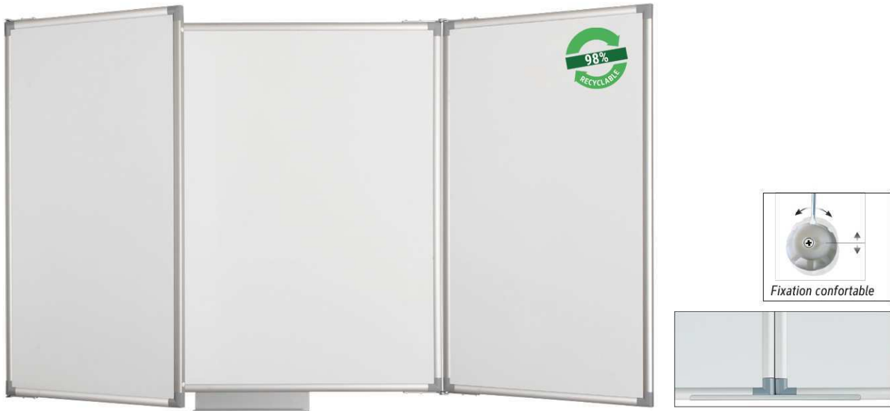
Tableau blanc triptyque MAULpro