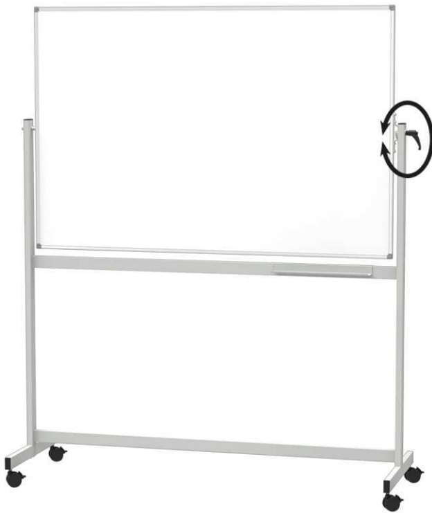
Tableau blanc mobile MAULstandard, réversible