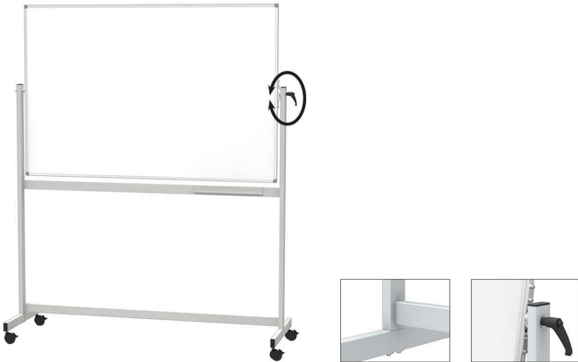
Tableau blanc mobile MAULstandard émaillé, réversible