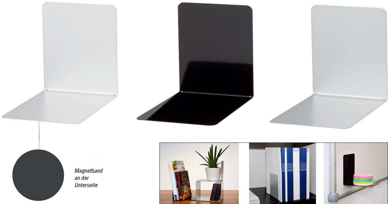
Magnetband an der Unterseite