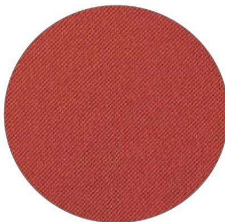
2. Rojo / Red