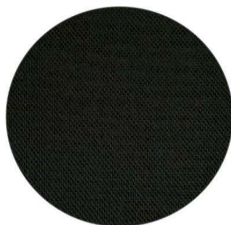
4. Negro / Black