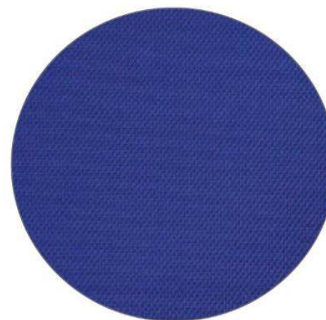
3. Azul / Blue