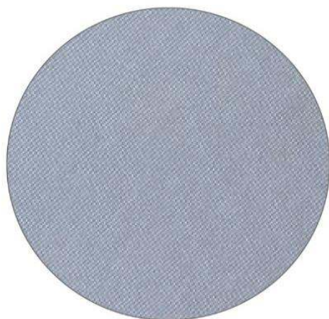
1. Gris / Grey