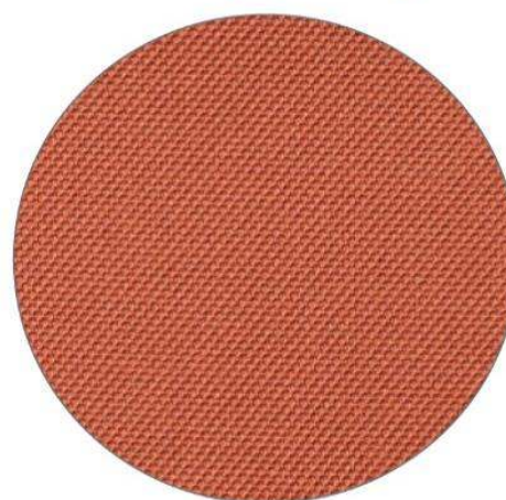
5. Naranja / Orange