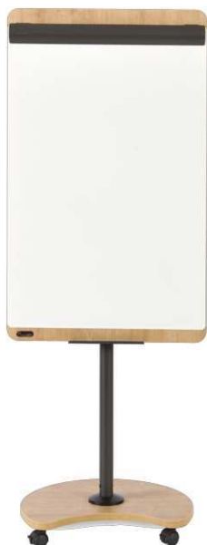
Tableau de Conférence Multifonctionnel et Mobile NATURAL